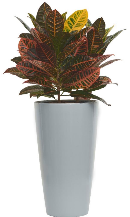
Linea Living: High Round 55 + Inner

IDeL Srl Via G. Matteotti, 1992 51036 Larciano (Pistoia) – Italia +39 0573 83355 info@idel.it