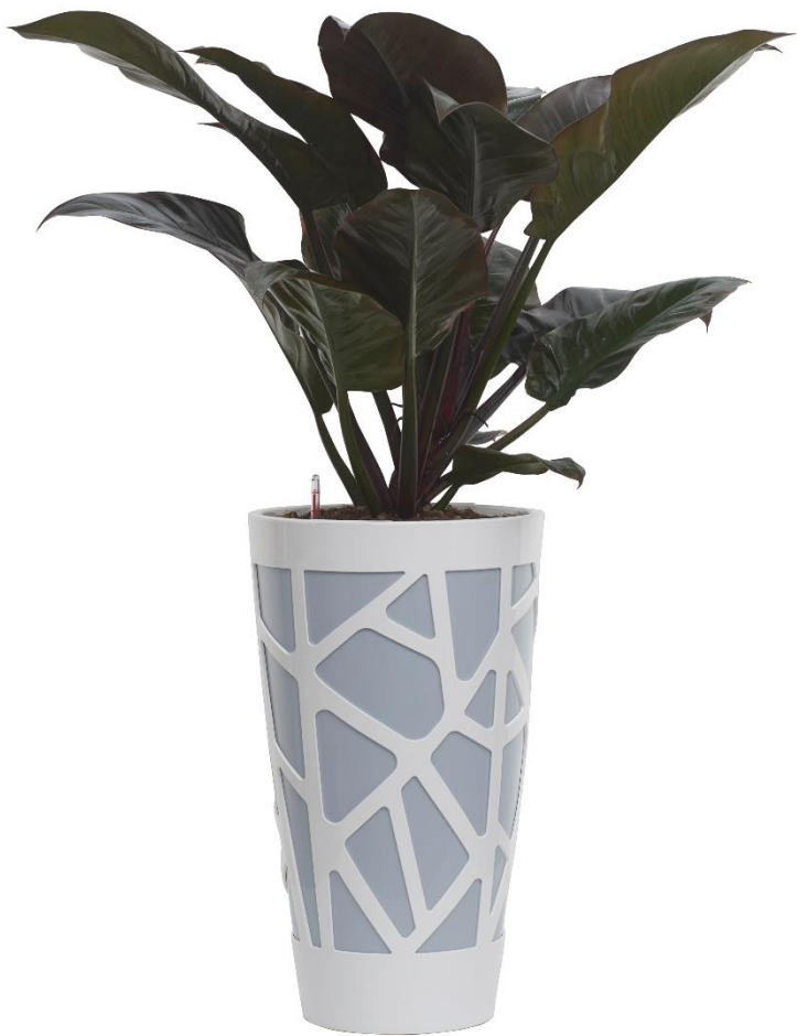
Linea Mosaic®: Curve High 55 + Inner